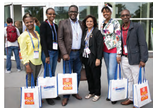
Participantes da Convenção de 2019

Nossa primeira Convenção foi em agosto de 1910 em Chicago, EUA.