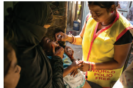
Rotariana ministrando a vacina antipólio

As contribuições dos nossos associados e de outras pessoas à Fundação nos permitem fazer mudanças positivas mundo afora. Pergunte ao especialista em Fundação Rotária do seu clube ou visite rotary.org/donate para saber como apoiar a nossa Fundação. Para saber mais, baixe o Guia de Referência da Fundação Rotária e faça o curso Noções básicas da Fundação Rotária na Central de Aprendizado .