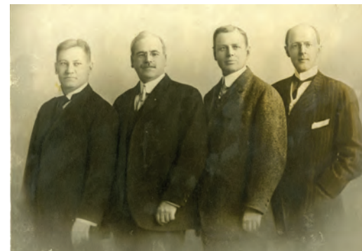
Os primeiros quatro rotarianos: Gustavus Loehr, Silvester Schiele, Hiram Shorey e Paul Harris, por volta de 1905-12

Há mais de 100 anos estamos fazendo história e aproximando os povos. O advogado Paul Harris fundou o primeiro Rotary Club em Chicago, nos Estados Unidos, em 1905. Ele queria reunir um grupo de profissionais de diferentes origens, históricos de vida e habilidades para fazer amizades. Em agosto de 1910, os 16 Rotary Clubs dos Estados Unidos formaram a Associação Nacional de Rotary Clubs, que veio a se tornar o Rotary International. Em 1912, o Rotary expandiu-se para mais alguns países e, menos de uma década depois, já havia Rotary Clubs na África, Ásia, América Central, Europa, Oceania e América do Sul. O Rotaract começou como um programa para jovens em 1968. Em 2019, o Rotaract passou por uma elevação, deixando de ser um programa e se tornando um tipo distinto de associação ao Rotary. Hoje, existem mais de 36.000 Rotary Clubs e 10.000 Rotaract Clubs espalhados em quase todos os países. Saiba mais sobre a história do Rotary em rotary.org/history .