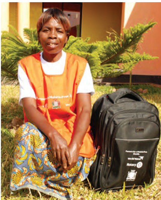
Uma das mulheres treinadas para ser agente de saúde pública na Zâmbia graças ao primeiro Subsídio de Grande Escala

Saiba mais em rotary.org/programsofscale .