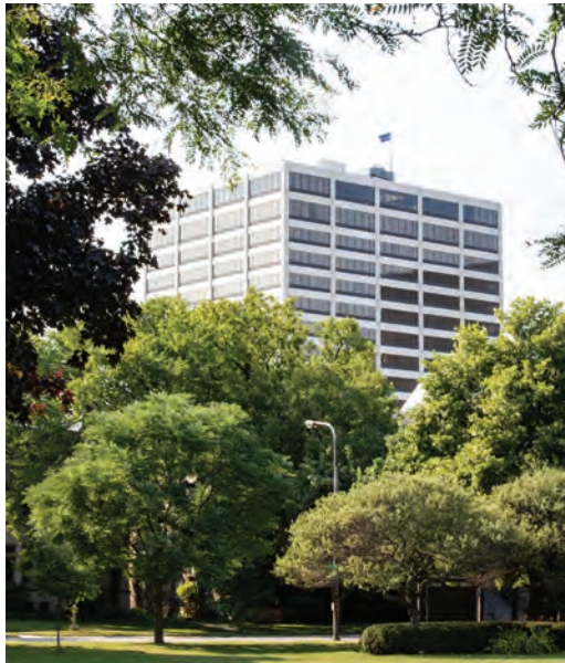
Sede Mundial do Rotary International em Evanston, Illinois, EUA

O Rotary International é administrado pela Secretaria, que reúne mais de 800 funcionários. A Sede Mundial fica no prédio One Rotary Center, em Evanston, estado de Illinois, EUA, e possui um auditório