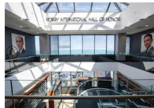
Galeria da Sociedade Arch Klumph, no 18º andar da Sede Mundial do Rotary International

Encontre o seu representante CDS em rotary.org/cds . Você também pode tirar dúvidas sobre o Rotary e seus programas enviando um e-mail para rotarysupportcenter@rotary.org .